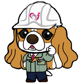
イメージキャラクター 夢を叶える「エルくん」