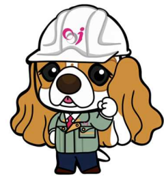
イメージキャラクター 夢を叶える「エルくん」